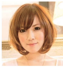
ゆるい内巻きは春にオススメのスタイル。

完成度の高いカット技術で、一人ひとりの長所や雰囲気をはっきり引き出し、髪が伸びていくことを計算して創られたそのデザインは、最低でも2ヶ月は決して崩れないという。さらに、それ以降は次回来店時まで存分に髪型の変化を楽しみながら過ごせるそう。お客さんとの気さくな会話の中からもヒントに、その人に似合った幅広いデザインを提案してくれるので、毎回新しい雰囲気に変身させてくれるのも嬉しい。