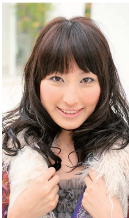
赤味を加えたツヤと深みのあるブラウンを入れることで、美肌効果と立体感を演出。「ゴフゴフしていた髪が、びっくりするくらい柔らかくて心地よいです」

☎0797-34-3416 (予約優先制) http://www.hair-genic.ftw.jp