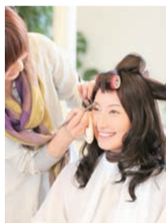
変身していくにつれて笑顔に変わるモデルさん。

今回のモデルさんは、5年以上カラーをしたことがなく、ボリュウムのないバツとした髪質。クールな印象から、「大人カワイイ」要素をプラスするため、長さはあまり変えず、レイヤードで顔周りを軽くするカットとカラーを取る